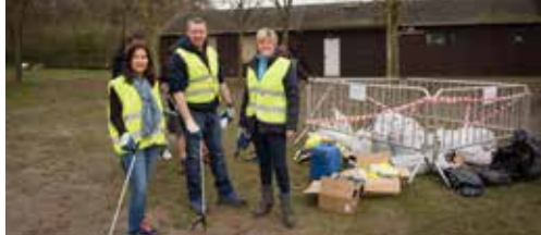
N-VA Waasmunster in beeld p. 2