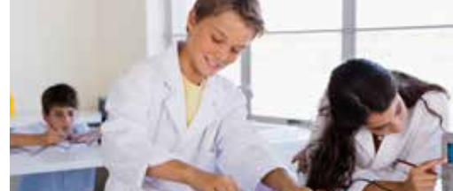
Waasmunsterse scholen zetten in op STEM p. 3